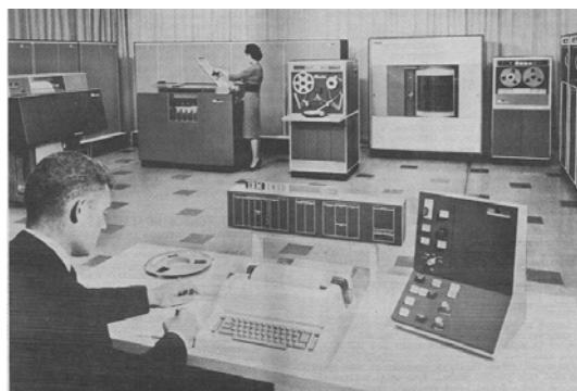
Slika 2.2 IBM-1410

Druga generacija računara (1957.-1963.) zamjenjuje elektronsku cijev tranzistorom. Dimenzije računara se znatno smanjuju, proizvode manje toplote, troše manje energije, postaju veoma pouzdani, povećava im se brzina rada, cijena im se snižava pa postaju pristupačniji širem krugu korisnika. Softver ovih računara se širi, tako da se pojavljuju i prve primjene u ekonomiji, medicini, hemiji, fizici itd. U radu se pojavljuju prvi put i simbolički jezici opšte namjene (FORTRAN, COBOL). Upotrebljavaju se magnetna jezgra kao primarne memorije, a pojavljuju se i magnetni diskovi kao novi medij sekundarne memorije. magnetna traka je najčešće korišteni I/O medij i sekundarna memorija, dok su bušene kartice ostale u širokoj upotrebi. Tipični predstavnici ove generacije računara su: IBM-1410, CDC-160, TCA-501 i drugi.