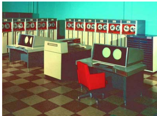
Slika 2.4 CDC 6600

Peta generacija (1985.- ) uključuje i elemente umjetne inteligencije.