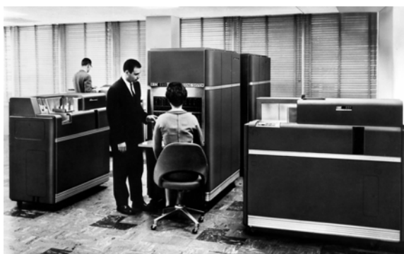
Slika 2.1 IBM-650

Prva generacija računara (1946.-1957.) karakteristična je po primjeni elektronskih cijevi u njihovoj konstrukciji. Ovi elementi su veoma nepouzdana u radu. Zbog potrebnog velikog broja ovih cijevi, računari su bili veličine jedne sobe, ponekad i veći, i trošili su mnogo energije, emitovali velike količine toplote, zahtijevali klimatizaciju, česte popravke. Primjene ovih računara su dosta male zbog nedorađenog softvera, tako da od njih korist ima samo uski, uglavnom naučni krug ljudi. Periferni uređaji kod ovih računara bili su: čitači bušenih kartica, magnetni bubnjevi i magnetne trake, te pisači odnosno štampači. Predstavnici ove generacije računara su UNIVAC I i II, IBM-650 i 704, BULL GAMMA idrugi.