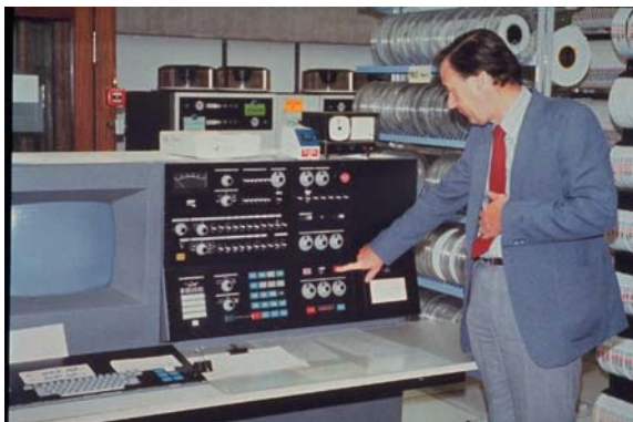
Slika 2.3 IBM-370

dugmeta. I dalje se smanjuju dimenzije računara uz permanentno povećanje brzine rada. Glavne memorije su od poluprovodničkih memorija, čiji se kapacitet povećao. Jedna od karakteristika je upotreba direktnih I/O uređaja. Računari ove generacije čine osnovu današnjih računara. Koriste za upravljanje bazama podataka, pojavljuju se jezici 4. generacije, javlja se veliki broj aplikativnih softvera kao što su programi za tablične izračune, za obradu teksta itd. Tipičan predstavnik je računar CRAY.